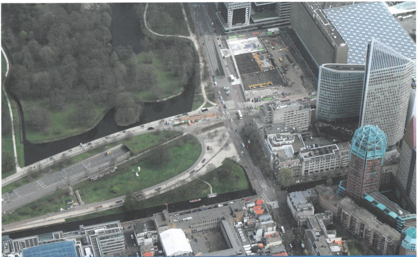
Luchtfoto tunnelmond aan de kant van de Koningskade