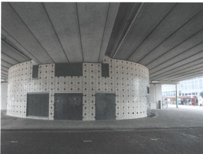
Het dienstgebouw van de Koningstunnel

Er zijn voor de tunnel meer installaties nodig dan nu. Daardoor is er meer ruimte nodig in het dienstgebouw dat bij de Koningstunnel hoort. Dit dienstgebouw staat onder het Prins Bernhardviaduct en wordt groter gemaakt en vernieuwd. De uitbreiding hiervan is half oktober 2018 gestart.