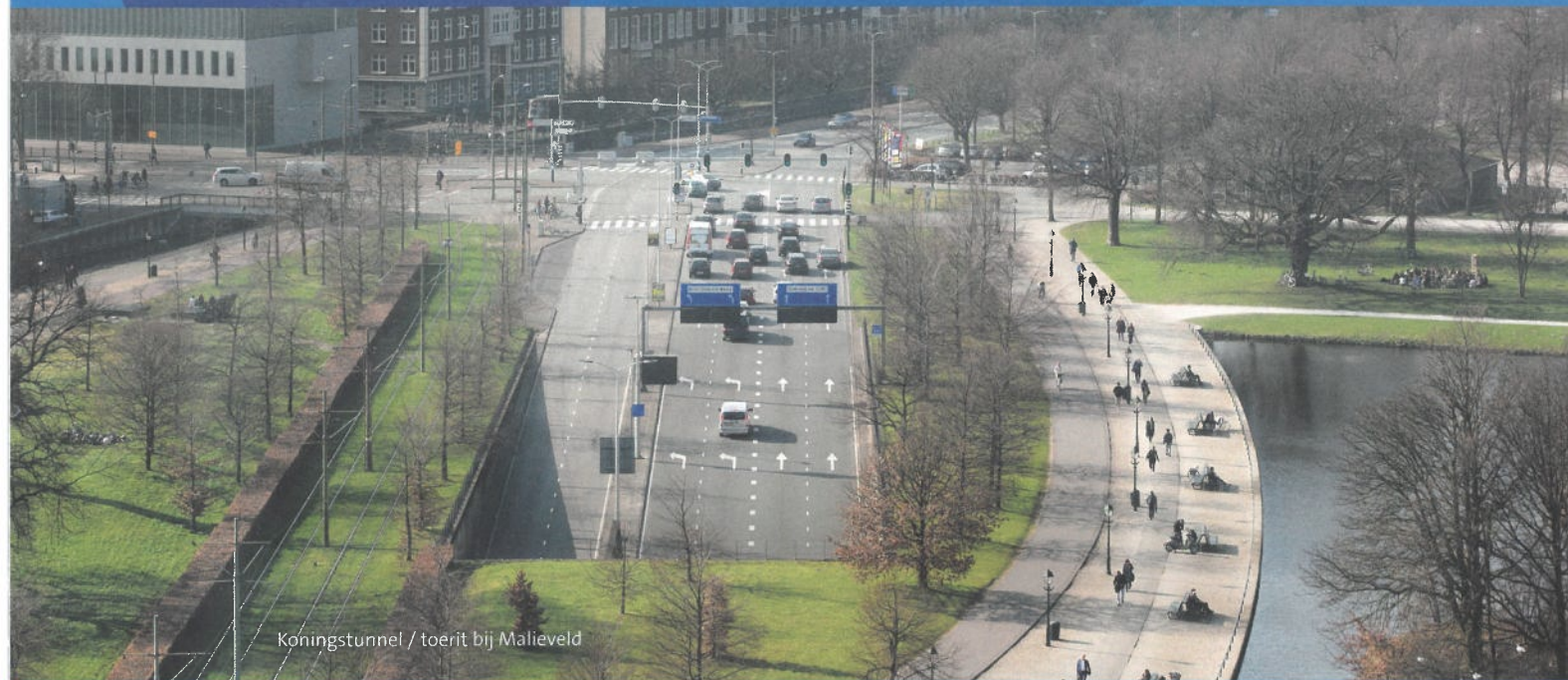
Koningstunnel / toerit bij Malieveld

Wat renovatie Koningstunnel Waar in de Koningstunnel Wanneer 1 maart tot uiterlijk 1 oktober 2019